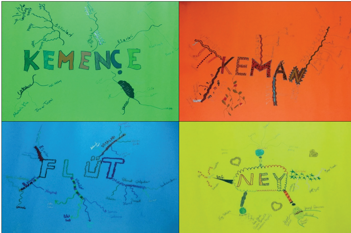
Şekil 2. Öğrenciler Tarafından Hazırlanan Zihin Haritaları Örnekleri

Planlar eşliğinde işlenen derse öğrenciler hazırlanarak gelmiştir. Gruplara ayrılan öğrenciler arkadaşlarıyla işbirliği içerisinde zihin haritalarını hazırlamışlardır. Öğrenciler, hazırladığı zihin haritaları üzerinde konuyu bir bütün olarak görmeye ve anlamaya çalışmışlardır (bk. Şekil 2).