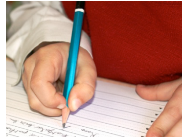
Orta Noktadan Kavrama f= 263 (% 64.6)