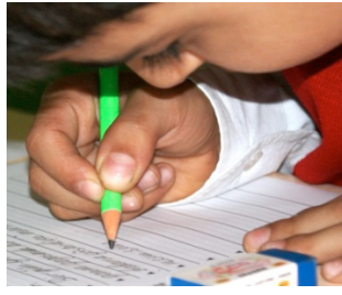
Üst Noktadan Kavrama f= 48 (% 11.8)