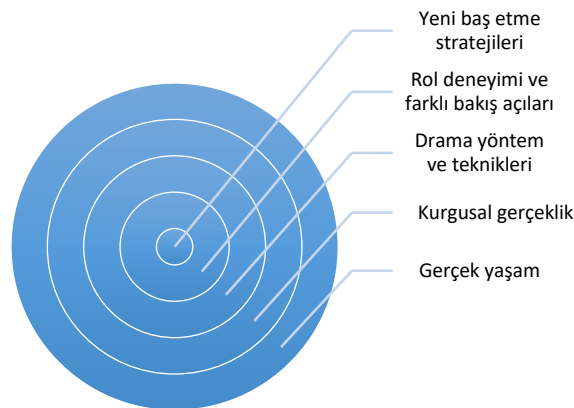
Şekil 2. Kurgusal gerçeklik deneyiminden baş etme stratejisine

Mesela aramızda belki daha önceden başına gelmiş vardır. Çok başına gelmiş belki. Ne yaptıkları falan önemli değil bunların. Bu arkadaşların deneyimleri olaya bakış açımı geliştirdi (K21, K, 17).